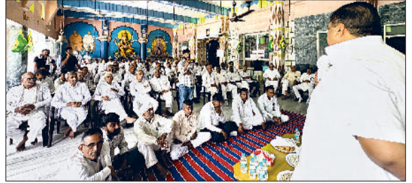
सिरसा। कार्यकर्ताओं को संबोधित करते हुए अजय चौटाला।