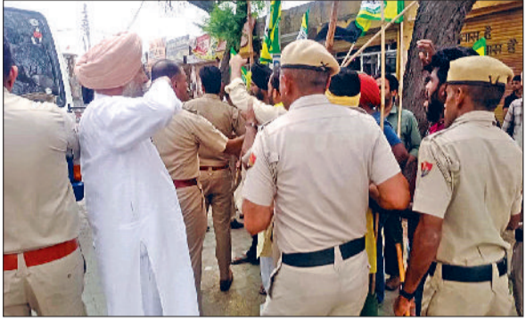
रतिया। भाजपा प्रत्याशी अशोक तंवर का विरोध कर रहे किसानों को रोकते पुलिस कर्मचारी।

सिरसा लोकसभा से भाजपा उम्मीदवार अशोक तंवर ने शुक्रवार को रतिया विधानसभा के अनेक गांवों का दौरा किया। रतिया पहुंचे भाजपा प्रत्याशी को किसान संगठनों के विरोध का सामना करना पड़ा। अशोक तंवर के रतिया आगमन पर इंकलाबी नौजवान सभा व भारतीय किसान यूनियन एकता उग्राहां के सदस्यों ने काले झंडे दिखाकर भाजपा नेताओं का विरोध किया और जमकर नारेबाजी की। किसानों द्वारा अशोक तंवर के काफिले के आगे आने पर पुलिस ने उन्हें रोकने की कोशिश की लेकिन किसान नहीं माने। किसानों द्वारा भाजपा नेताओं की गाड़ियों के आगे जाकर रोकने का प्रयास करने पर पुलिस ने करीब 20 किसानों को हिरासत में लेकर उन्हें पुलिस लाइन भेज दिया है। बता दें कि इससे पहले भी किसान संगठनों द्वारा रतिया में 5 अप्रैल को मुख्यमंत्री की रैली के दौरान विरोध करने पर पुलिस द्वारा किसानों को गिरफ्तार किया गया था। रतिया में प्रचार के लिए आ रहे