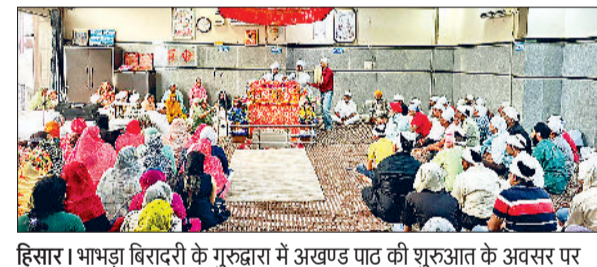
हिसार। भाभड़ा बिरादरी के गुरुद्वारा में अखण्ड पाठ की शुरुआत के अवसर पर उपस्थित श्रद्धालु।