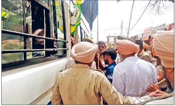
रतिया। भाजपा प्रत्याशी अशोक तंवर का विरोध कर रहे किसानों को रोकते पुलिस कर्मचारी।