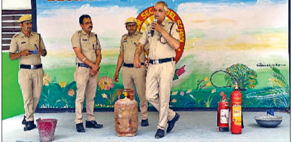
फतेहाबाद। सीनियर सेकेण्डरी मॉडल स्कूल भिरडाना में विद्यार्थियों को जागरूक करते फायर टीम के सदस्य।