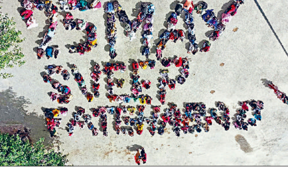
फतेहाबाद। मतदाता जागरूकता कार्यक्रम के तहत मानव श्रृंखला बनाती महिला कॉलेज की छात्राएं।

तथा स्वतंत्र, निष्पक्ष व शांतिपूर्ण निर्वाचन की गरिमा को अक्षुण्ण रखते